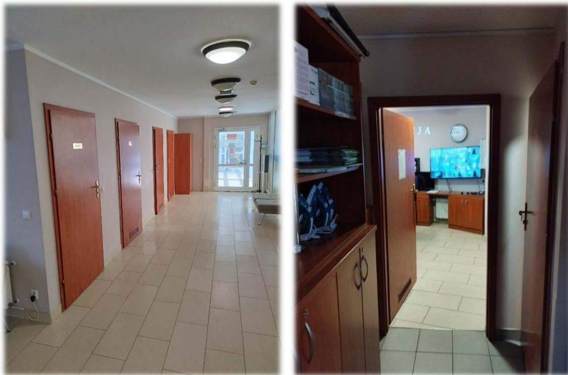
Fotografia nr 13 i 14 – hol główny – Stolarka drzwiowa

Stolarka drzwiowa w korytarzu holu przeznaczona do wymiany wraz z ościeżnicami.