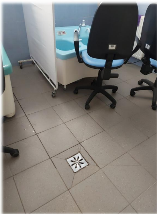
Fotografia nr 11 – pom. S2-1.28 – Kratka odpływowa

Kratki odpływowe w stanie dobrym (4 szt.) – nie mniej należy wymienić przy wymianie wykończenia podłogi.