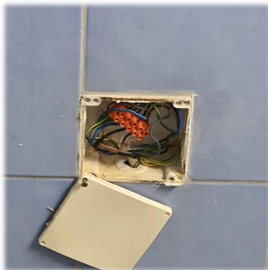
Fotografia nr 4 – pom. S2-1.27 – Złącza kablowe

REMONT TRZECH POMIESZCZEŃ HYDROTERAPII ORAZ WYMIANA 6 DRZWI I OŚWIETLENIA GÓRNEGO W HOLU PRZY RECEPCJI W NIERUCHOMOŚCI FSUSR W ŚWINOUJŚCIU UL. M. KONOPNICKIEJ 17, Dz. nr 82, 83, 87, 88 OBR. 326301_1.0001 ŚWINOUJŚCIE 1, GM. M. ŚWINOUJŚCIE, POWIAT ŚWINOUJŚCIE