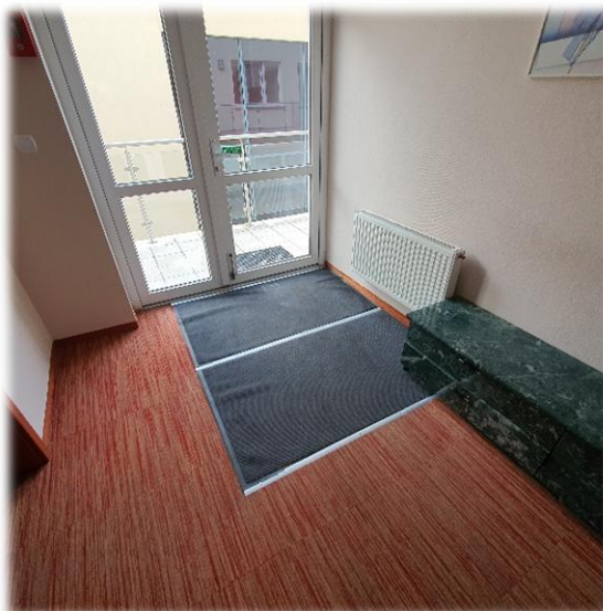
FOT. 17 – Korytarz na piętrze – wyjście na taras/balkon

Na piętrze znajduje przed wyjściem na taras znajduje się wycieraczka.