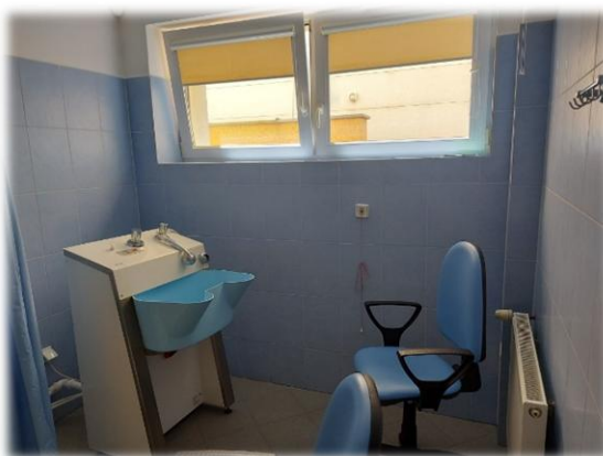
Fotografia nr 2 – pom. S2-1.28 - Lewa część pomieszczenia