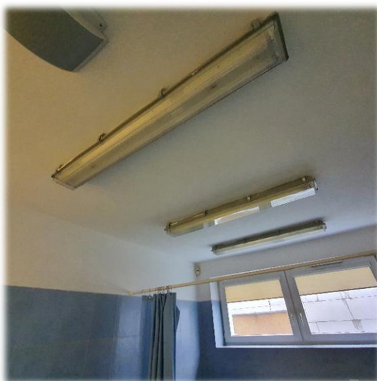
Fotografia nr 6 – pom. S2-1.28 – Stan inst. oświetlenia

Oświetlenie górne do wymiany. Oprawy straciły swoją sprawność oraz noszą znamiona wyeksploatowania. Przewody instalacji do oświetlenia, gniazd i wyłączników należy poprowadzić nową.