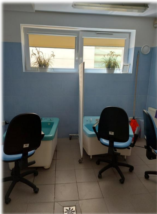
Fotografia nr 3 – pom. S2-1.28 - Prawa część pomieszczenia

REMONT TRZECH POMIESZCZEŃ HYDROTERAPII ORAZ WYMIANA 6 DRZWI I OŚWIETLENIA GÓRNEGO W HOLU PRZY RECEPCJI W NIERUCHOMOŚCI FSUSR W ŚWINOUJŚCIU UL. M. KONOPNICKIEJ 17, Dz. nr 82, 83, 87, 88 OBR. 326301_1.0001 ŚWINOUJŚCIE 1, GM. M. ŚWINOUJŚCIE, POWIAT ŚWINOUJŚCIE