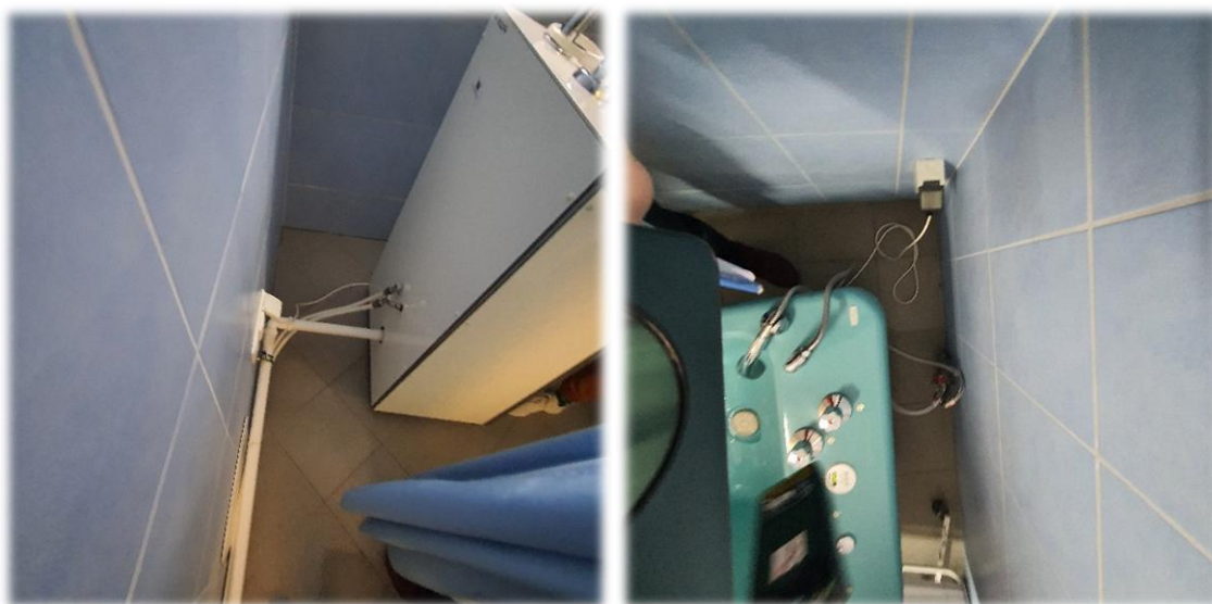
Fotografia nr 9 i 10 – pom. S2-1.28 – Przyłączenia wodne do urządzeń

Podłączenia wody do urządzeń należy wymienić na nowe. Lokalizację ostateczną ustalić z użytkownikiem.