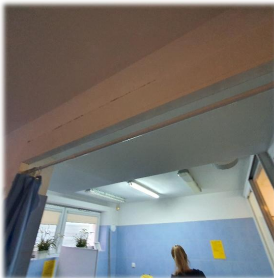
Fotografia nr 1 – pom. S2-1.28 – połączenie pomieszczeń / sposób rozdzielania

Pomieszczenia radioterapii S2-1.27 i S2- 1.28 są pomieszczeniami oddzielnymi. Pomieszczenie S2-1.28 jest pomieszczeniem podzielonym na dwie strefy przez co jest przez użytkownika traktowany jako dwa pomieszczenia oddzielane przegrodą tymczasową np. aktualnie pomieszczenia są wydzielone przesłoną na drążku rozporowym.