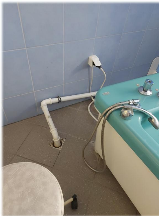
Fotografia nr 5 – pom. S2-1.28 – Stan instalacji elektrycznej i sanitarnej

Gniazda i wyłączniki sprawne, lecz są w stanie technicznym kwalifikującym je do wymiany. Urządzenia podłączone na przedłużaczach. Lokalizację włączników należy zmienić zgodnie z rysunkami br. elektrycznej. (rys. E1)