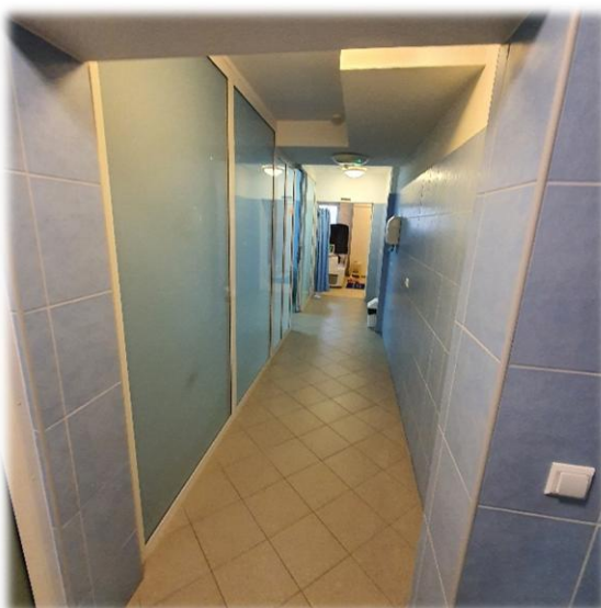
Fotografia nr 7 – korytarz

W stolarce drzwiowej przesuwnej widać braki w uszczelkach drzwiowych – ogólny stan drzwi dobry.