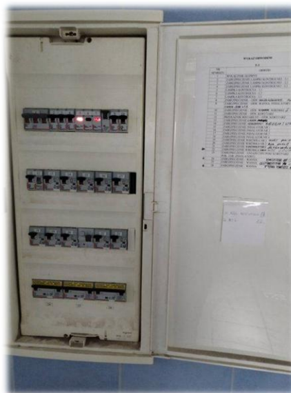
Fotografia nr 18 – korytarz przy pom. S2-1.27 – Rozdzielnia elektryczna

Instalacja elektryczna gniazdowa natynkowa. Urządzenia na stałe podłączone do dedykowanych gniazd. Całą instalację należy przewidzieć do wymiany ze względu na zły stan techniczny.