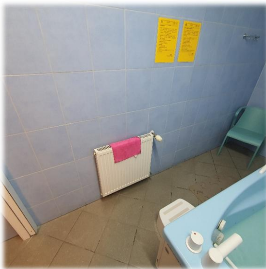
Fotografia nr 8 – pom. S2-1.27 – Widok na inst. C.O.

Grzejniki w złym stanie należy je wymienić. Ilość 3 szt.