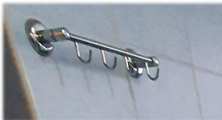
Fotografia nr 19 – pom. S2-1.28 – Ist. haczyki ścienne

W pomieszczeniach są zamontowane haczyki ścienne na ręczniki dla kuracjuszy. Ilość 2 szt.